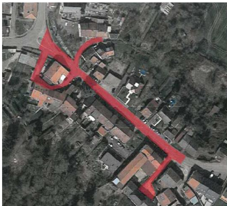
Rue d'Oudrenne - Métrich

Monsieur le Maire rappelle à l'assemblée que la commune envisage en 2022, de réaliser des travaux d'enfouissement de réseaux secs (réseaux Basse Tension, Eclairage Public et Orange) à Métrich au niveau de la rue d'Oudrenne, comprenant 30 branchements sur une longueur de 300 ml. Le coût estimatif du projet s'élève à 240 000 € HT